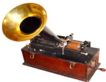
Phonographe d'Edison, 1877