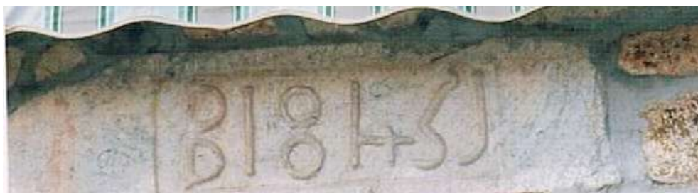
Linteau de fenêtre de l'auberge

Sans doute c'est à eux que revient la construction de la maison qui deviendra l'auberge actuelle d'Eglisolles au centre du bourg,