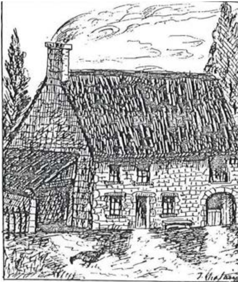
Ferme de la vallée de l'Ance.

Notre maison paternelle comprenait deux étages. Au rez-de-chaussée était située la cuisine avec une porte vitrée et une toute petite fenêtre ; elle communiquait avec une chambre nommée vulgairement cabinet où étaient deux grandes alcôves avec deux portes à coulisses servant de lit ; une fenêtre assez grande l'éclairait.