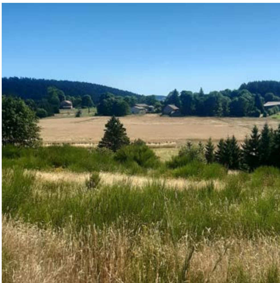
Village de Molhac